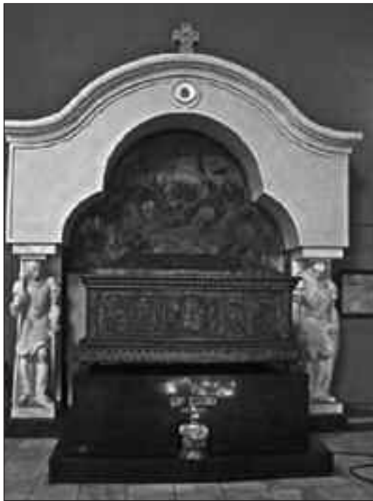
Маркова црква у Београду Саркофаг са моштима цара Душана