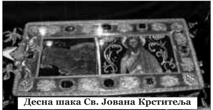
Десна шака Св. Јована Крститеља

за реликвије. Да ли је црногорски председник обећао Малтешким витезовима светиње, уколико они логистички и финансијски подрже пројекат црногорске независности, показаће се ускоро када се разреши и потпуно неизвештан исход најављеног референдума.