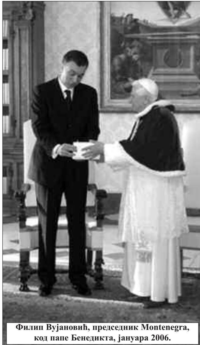
Филип Вујановић, председник Montenegro, код папе Бенедикта, јануара 2006.

реликвије немају цену, јер су од огромне вредности. Ипак, додао је Ницовић, за икону Богородице Филермоске би на светском тржишту, могли добити и десет милијарди долара. Да ли је тај податак важан црногорском режиму, коме ништа није свето!?