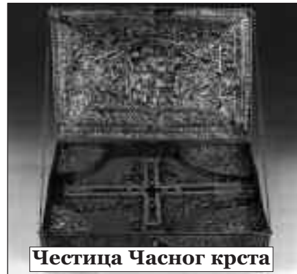
Честица Часног крста

Када је Наполеон заузео Малту 1798. године, Малтешки витезови су били принуђени на изгнанство. Светиње су предали најјачој хришћанској земљи света - Русији, иако је она била православна. Цар Павле I, добија титулу витеза овог реда и тако постаје, не само први православац, кавалер малтешког реда, већ и Велики магистар, односно вођа "Малтежана". Светиње су се тако обреле у цркви у близини Зимског дворца у Петрограду и тај дан и данас прославља Руска црква као дан када су се светиње вратиле под окриље хришћанског цара.